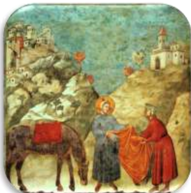
Giotto - Francesco dona il suo mantello ad un povero

Insignita del premio «Pax et Bonum 2010» per l'opera di diffusione del messaggio francescano attraverso il canto e la recitazione, la Cantoria di Giubiasco ha da sempre posto al centro del proprio cammino artistico e spirituale la figura di Francesco d'Assisi. Nel tempo, incoraggiata e sostenuta dal compianto padre Callisto Caldelari, ha proposto numerose sacre rappresentazioni dedicate alla vita del Santo e commissionato a diversi compositori la realizzazione di brani tratti dai suoi testi originali o liberamente ispirati alla sua esperienza umana e spirituale. Oltre che a Giubiasco, questo messaggio è stato portato in diverse località del Ticino, così come ad Assisi, Firenze e Roma.